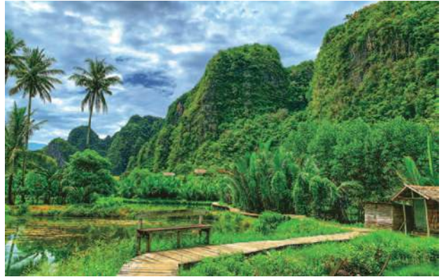
ラマンラマン(マカッサル)