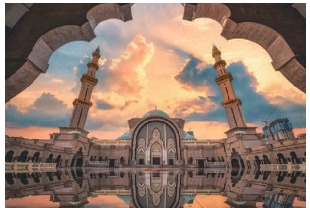
連邦直轄鎮モスク(ポートケラン)