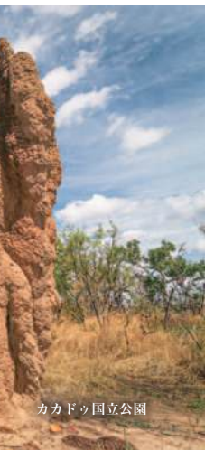
カカドゥ国立公園

コモド国立公園内しか生息していない、古代の姿のまま生きている貴重なコモドオオカゲに出会えます。