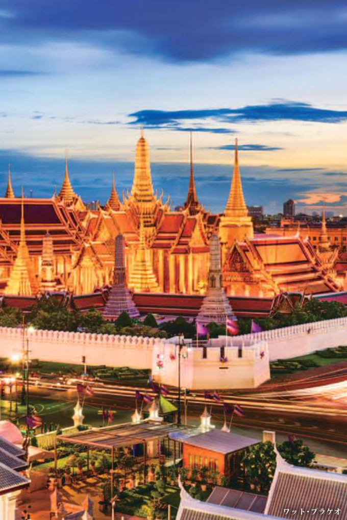
ワット・フラクオ