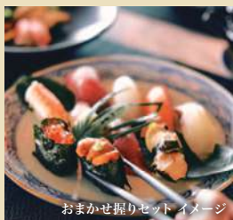
おまかせ握りセット イメージ

※ご予約は船上で承ります。詳しくは船上でご案内いたします。※寿司はご提供のない日もございます。