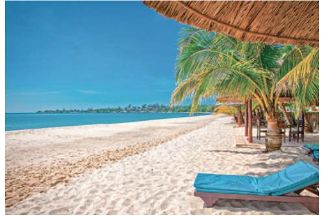
ソカビーチ(シアヌークビル)