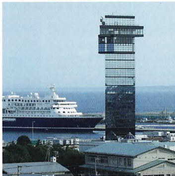
大洗マリンタワー