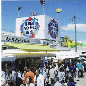
那珂湊おさかな市場