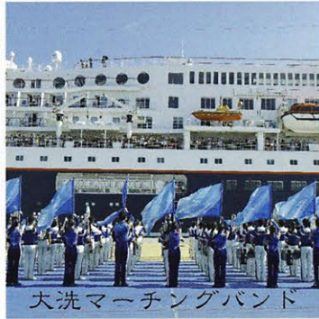
大洗マーチングバンド