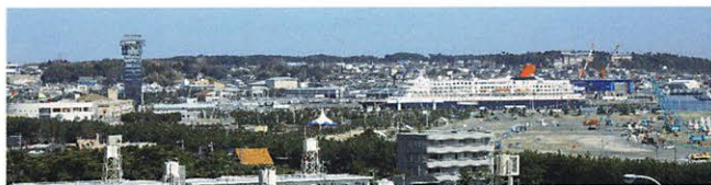
国営ひたち海浜公園

人気の海水浴場サンビーチのすぐ隣りに岸壁があり、港の前にはショッピングモールもあります。各地へのアクセスも良く、北関東を代表する観光港として有名です。