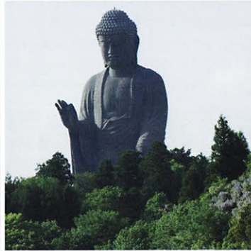
世界一の牛久大仏