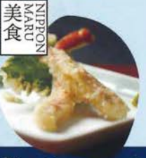
美食 NIPON MAKU