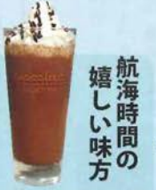
航海時間の嬉しい味方

船内のソフトドリンクは基本的に無料。中でもゴディバのシヨコリキサーが大人気。航海時間を彩ります。